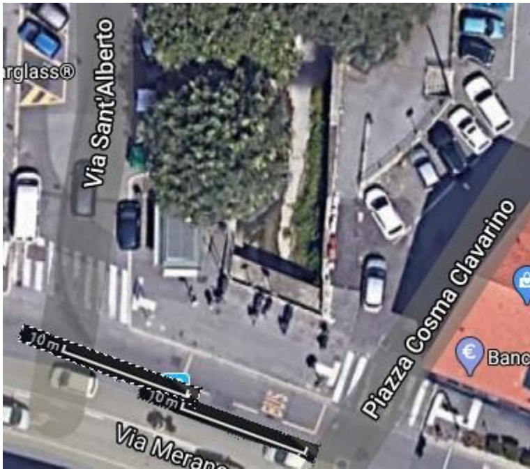
La stessa area da Google Maps, con il